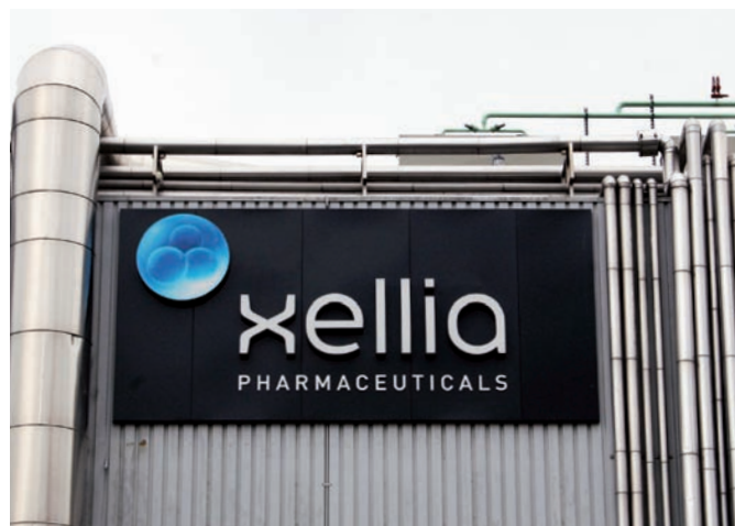
Xellia Pharmaceuticals har produktionsenheder i Danmark, Norge, Ungarn og Kina.

Fra at være startet med Sertica udelukkende til brug for dokumentation i forhold til myndigheder og kunder er systemet langsomt blevet udvidet både i forhold til funktion, men i høj grad i forhold til antal brugere. I 1999 startede Xellia Pharmaceuticals ud med 10 brugere. I 2010 nåede antallet af brugere op på hele 55.